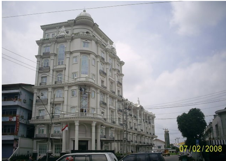
HOTEL SAHID IMARA