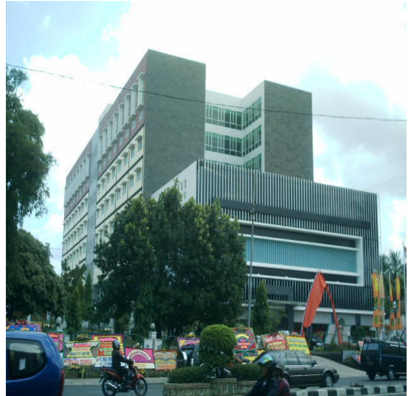
HOTEL JAYAKARTA DAIRA