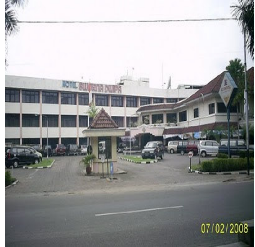
HOTEL SWARNA DWIPA