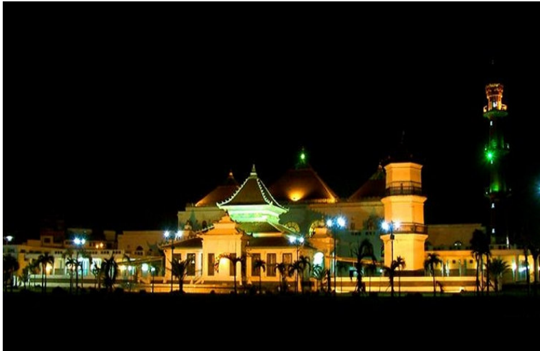
Mesjid Agung: Sultan Mahmud Badaruddin